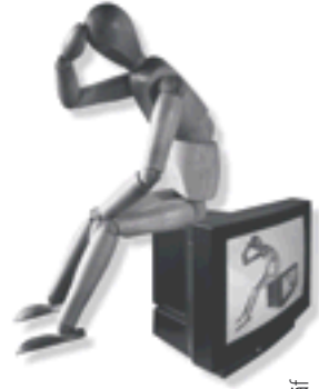
Illustration: Norbert Gräf