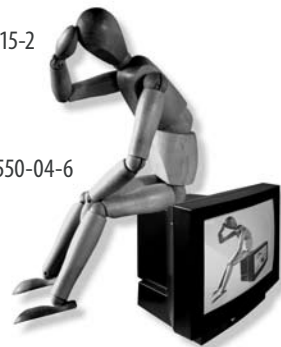
Illustration: Norbert Gräf

tellerrandwärts _ ISBN 978-3-937550-14-5