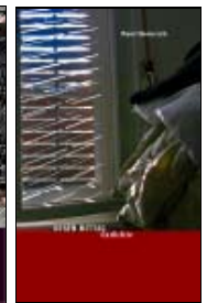
Heinrich' Gedichte GEGEN MITTAG