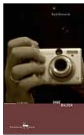
Heinrich' Gedichte INNE HALTEN