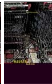
Heinrich' Gedichte HAUSER