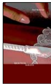
Heinrich' Gedichte NACH TISCH